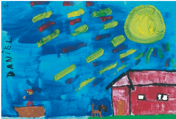
„Kleiner Mann geht mit dem Boot auf Reise“ (Junge 8 Jahre)

Schulkinder bis etwa neun Jahren zeigen ein eher sachliches Interesse am Tod und möchten oft gern mehr darüber erfahren. Sie wissen um die Endgültigkeit („ewiger Schlaf“) des Todes. Sie können Angst haben, verlassen zu werden, Angst vor dem Tod der Eltern. Bis zum zehnten Lebensjahr begreifen Kinder immer schneller und deutlicher, was Tod bedeutet.