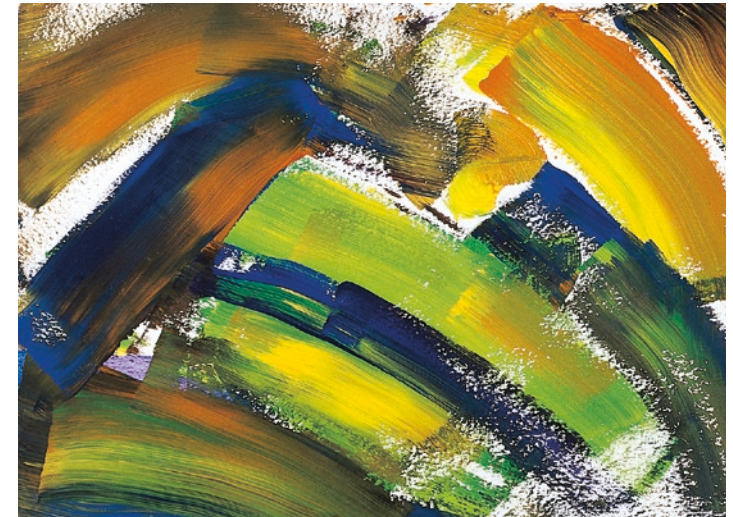
„Der zerbrochene Regenbogen“ (Mädchen 14 Jahre)

Vielleicht muss von allen Beteiligten auch entschieden werden, ob lebensverlängernde Maßnahmen (nicht) eingeleitet oder abgebrochen werden sollen. Ärzte und Pflegepersonal haben die schwierige Aufgabe, die richtigen Worte für das Kind und seine Eltern zu finden und Konflikte mit den Angehörigen über die weiteren Behandlungsschritte möglichst zu vermeiden.