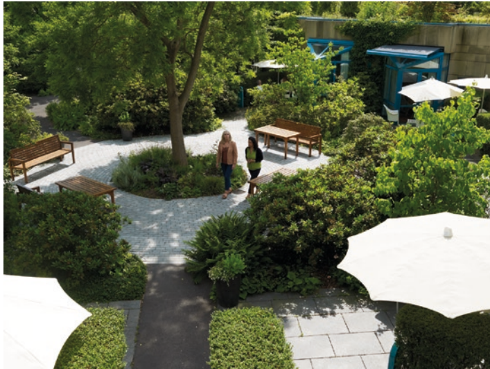
Blick in den Garten des Dr. Mildred Scheel Hauses